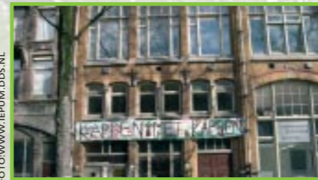
Protest op de Bilderdijkstraat

Niet zo lang geleden, tijdens een discussiebijeenkomst in De Rode Hoed, hoorde ik voor het eerst van een onderzoek van Staatsbosbeheer: 70 % van de stadskinderen zou niet meer in contact komen met natuur. Een ongeloflijk percentage, vond ik. Op het eerste gezicht ook een beetje ongeloofwaardig, omdat