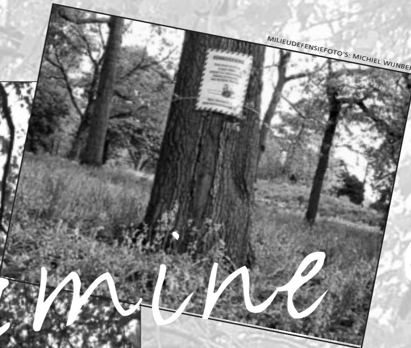
MILIEUDEFENSIEFOTO'S: MICHEL WUNBERGH

Een boom hier, een bos daar, een heel landschap zelfs. De natuur is altijd de klos. En uiteindelijk ook de mens. Alleen beseffen we dat niet altijd; of we willen het niet weten. Opvallend hoe vaak burgers in deze tegenover de overheid staan. Een strijd die meestal ongelijk is, hoewel niet altijd kansloos. Soms biedt Europa een steuntje in de rug en soms de Raad van State. In geval van grote verontwaardiging, zoals recentelijk in Swifterband, wint de redelijkheid. De laatste jaren weet de burger zich geruggensteund door de nieuwste wetenschappelijke bevindingen inzake natuur en gezondheid (omgevingspsychologen spreken over Vitamine G). Een brief aan het Stadsdeel Oud-West.