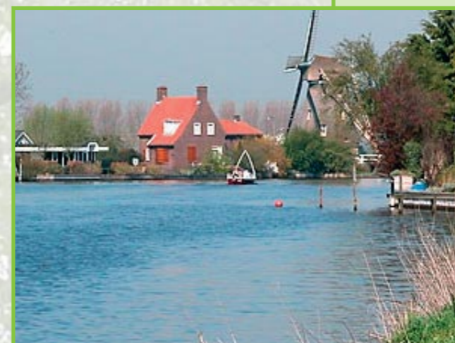
Langs de Vecht

De door u voorgenomen kap van tientallen bomen vindt niet plaats in een bosrijke omgeving, maar in het