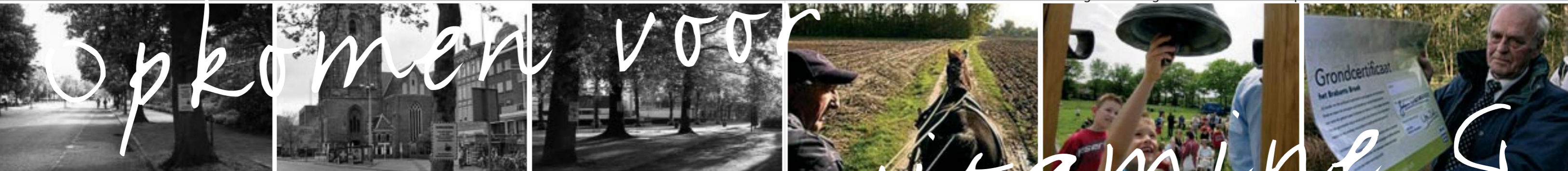
Actie Milieudefensie mei 2005: red de bossen in 12 steden.

Protest tegen autoweg door coulissenlandschap tussen Eindhoven en Helmond